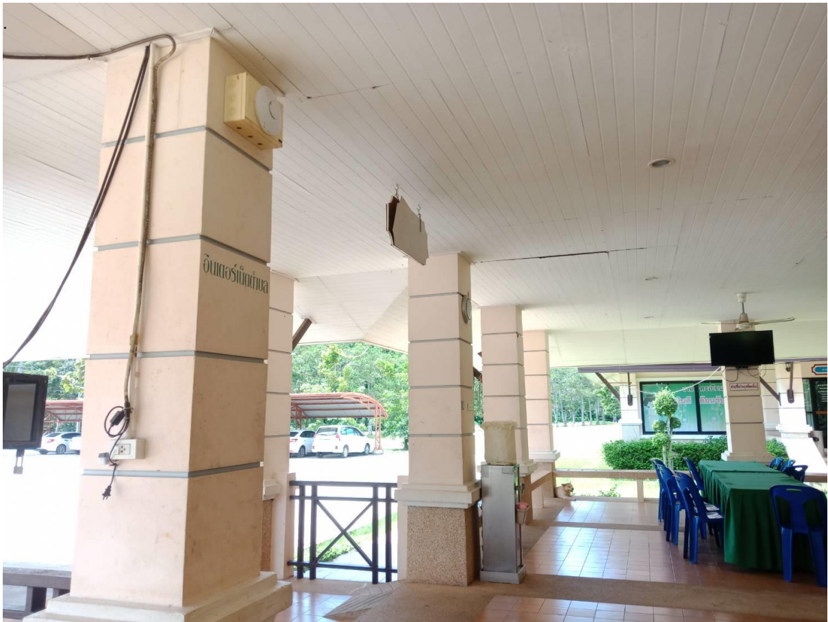
ห้องสำนักงานปลัด